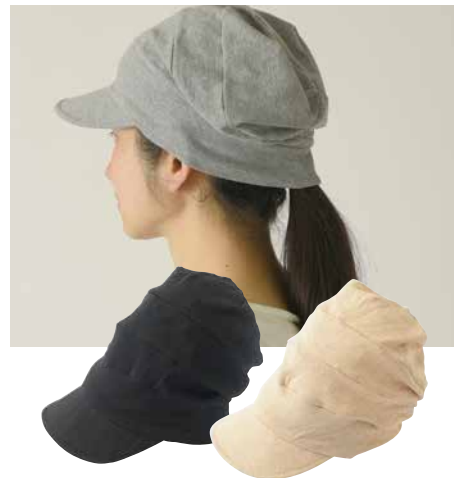
C-6102 段々キャスケット 価格 2,970 円 (税込) サイズ: 56.0 ~ 58.0cm 色: ブラウン・ブラック・グレー