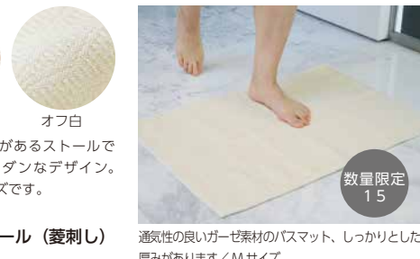
A-8129 new ガーゼバスマット (M) 価格 2,700 円 (税込) サイズ: 45x68cm 色: オフ白

刺子織りの凹凸があるストールです。菱刺しのモダンなデザイン。レギュラーサイズです。