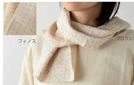
A-8127 ふんわりガーゼマフラー (フロラシエンテ / フィノス) 価格 2,484 円 (税込) サイズ: 23x100cm

夏用ひざ掛け、バスタオル代わりに、ベビーブランケットに薄手ガーゼは乾きも早くお手入れ簡単 / 2 柄