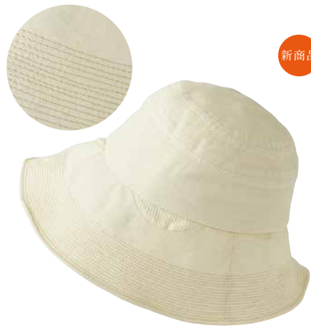
C-8202 ガーゼハット 価格 6,264 円 (税込) サイズ: M 57.5cm (56cmまで調整可) 色: オフ白