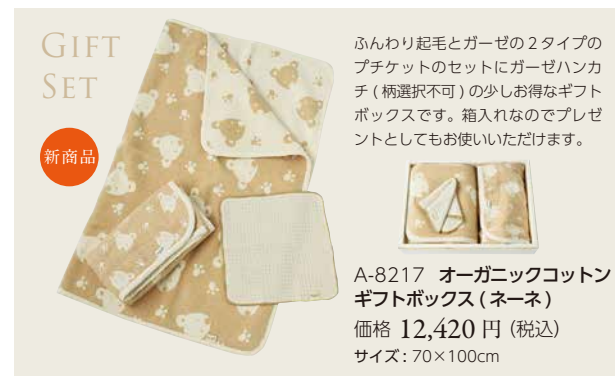
A-8217 オーガニックコットン ギフトボックス (ネーネ) 価格 12,420 円 (税込) サイズ: 70x100cm

洗う度にふんわり優しい肌触りのハンカチ。嵩張らずにコンパクトなサイズ / 2 柄