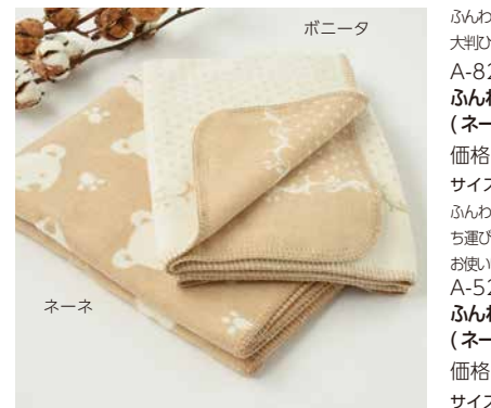
A-8216 オーガニックコットン ふんわりハーフケット (ネーネ、ポニータ) 価格 9,720 円 (税込) サイズ: 140x100cm

A-8130 クッションカバー 価格 3,240 円 (税込) サイズ: 45x45cm 色: オフ白