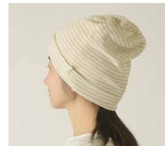
C-6204 クレープロングワッチ 価格 2,970 円 (税込) サイズ: 56.0 ~ 58.0cm 色: ナチュラルポルダー

たっぷり深めに被れ表情のあるデザイン。首まで入れればネックウォーマーにもなる 2WAY の帽子です。