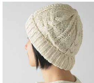
C-7207 縄編みニットワッチ 価格 3,996 円 (税込) サイズ: 56.0 ~ 58.0cm 色: オフ白

オーガニックコットンのポアと表面はベルベットを使用した暖か帽子。リバーシブルで被れて耳まですっぽりです。