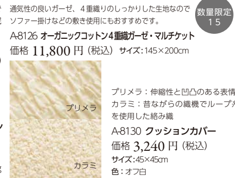
A-8126 オーガニックコットン 4重織ガーゼ・マルチケット 価格 11,800 円 (税込) サイズ: 145x200cm

ふんわりと丁寧に起毛した綿毛布です。心地よい肌触りが安らかな睡眠時間を手助けします。