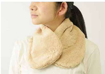
C-5202 襟マフ 価格 4,968 円 (税込) サイズ: フリー 色: ブラウン・オフ白

肉厚で凹凸感のある素材で防寒にもなります。そのまま被っても折り返して被っても OK。