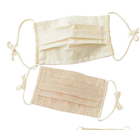
C-5103 立体マスク 価格 1,296 円 (税込) サイズ: フリー (紐調整) 色: オフ白・ブラウン