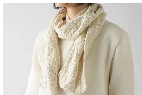
C-7208 縄編みニットマフラー 価格 8,100 円 (税込) サイズ: 巾: 20cm 長さ: 160cm 色: オフ白

室内での冷え取りはもちろんです。外出時はアウトターの襟部分につければエレガントな雰囲気。裏面にボタンが付いています。