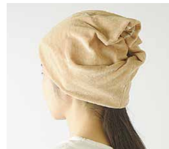
C-5203 スクリューワッチ 価格 3,996 円 (税込) サイズ: 56.0 ~ 58.0cm 色: ブラウン

たっぷり深めに被れ表情のあるデザイン。首まで入れればネックウォーマーにもなる 2WAY の帽子です。