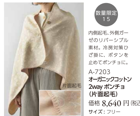
A-7203 オーガニックコットン 2way ボンチョ (片面起毛) 価格 8,640 円 (税込) サイズ: フリー

内側起毛、外側ガーゼのリバーシブル素材。冷房対策ひざ掛けに、ボタンを止めてボンチョに。