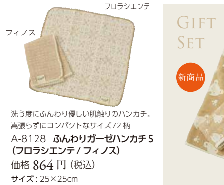
A-8128 ふんわりガーゼハンカチ (フロラシエンテ / フィノス) 価格 864 円 (税込) サイズ: 25x25cm

内側起毛、外側ガーゼのリバーシブル素材。冷房対策ひざ掛けに、ボタンを止めてボンチョに。