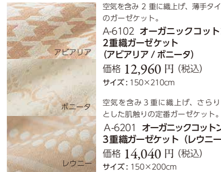
A-6102 オーガニックコットン 2重織ガーゼケット (アビアリア / ポニータ) 価格 12,960 円 (税込) サイズ: 150x210cm