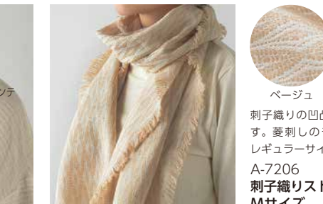
A-7206 刺子織りストール (菱刺し) Mサイズ 価格 8,640 円 (税込) サイズ: 35x160cm 色: ベージュ・オフ白

刺子織りの凹凸があるストールです。菱刺しのモダンなデザイン。レギュラーサイズです。