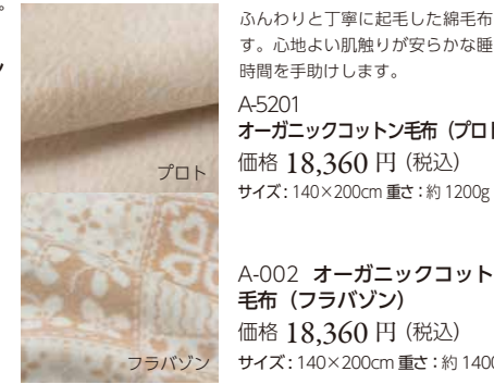
A-5201 オーガニックコットン毛布 (プロト) 価格 18,360 円 (税込) サイズ: 140x200cm 重さ: 約 1200g

ふんわりと丁寧に起毛した綿毛布です。心地よい肌触りが安らかな睡眠時間を手助けします。