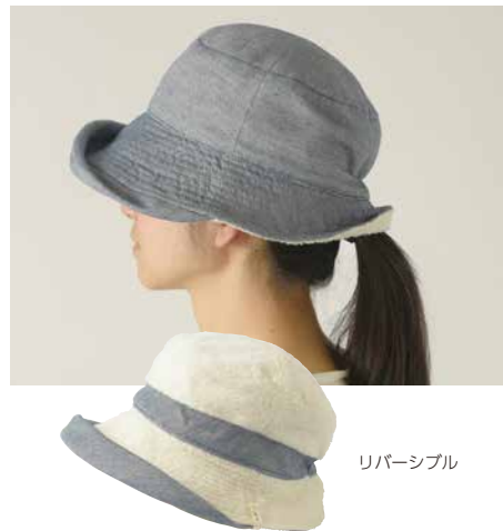
C-6101 パイル帽子 価格 6,264 円 (税込) サイズ: M: 57.5cm (56cmまで調整可) 色: ネイビー