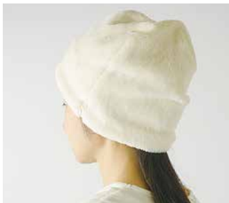
C-055 ポアワッチ 価格 4,968 円 (税込) サイズ: 56.0 ~ 58.0cm 色: ブラウン・オフ白

オーガニックコットンのポアと表面はベルベットを使用した暖か帽子。リバーシブルで被れて耳まですっぽりです。